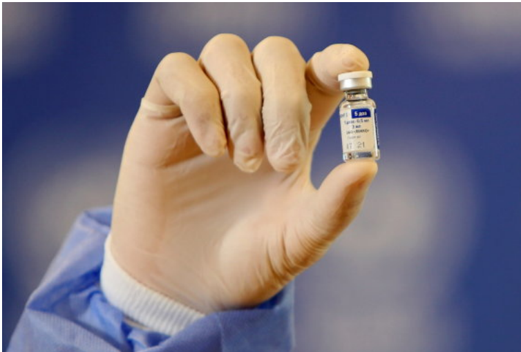
„Sputnik V“ vakcina

„Būtina pabrėžti tai, kad Europos vaistų agentūra nėra patvirtinusi „Sputnik V“ vakcinės, todėl pirmieji rezultatai turi būti papildomai įvertinti. Visgi Vengrija, kaip žinome, jau yra paskelbusi apie savo sprendimą naudotis šia vakcina. Formaliai valstybės narės gali savarankiškai spręsti tokius klausimus. Aišku viena – nuo pat viruso atsiradimo, šis klausimas buvo paverstas geopolitine diskusija. Kai kam, spėju, tai nepatinka – medicams norėtųsi, kad tokie klausimai nebūtų siejami su geopolitiniais santykiais.