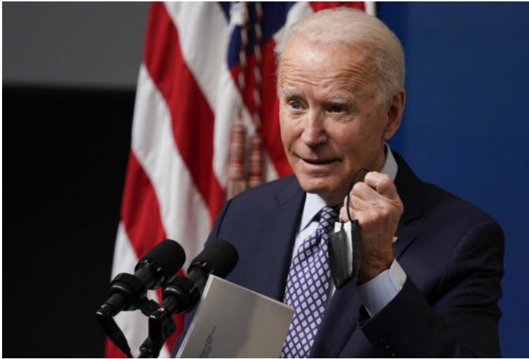
Joe Bidenas

svarbu atliepti ir respublikonų rinkėjų lūkesčius, ypač tų, kurie praėjusiuose rinkimuose balsavo už D.Trumpą, taip netiesiogiai palaikydami jo vykdytą politiką. Šios politinės aplinkybės riboja jo veiksmų laisvę šalinant kliūtis egzistuojančias ekonominiams santykiams su sąjungininkais bei rodant lyderystę daugeliu pasaulio ekonomikos klausimų.